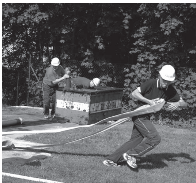
soutěž na Peci: o zajímavé momenty nebývá nouze