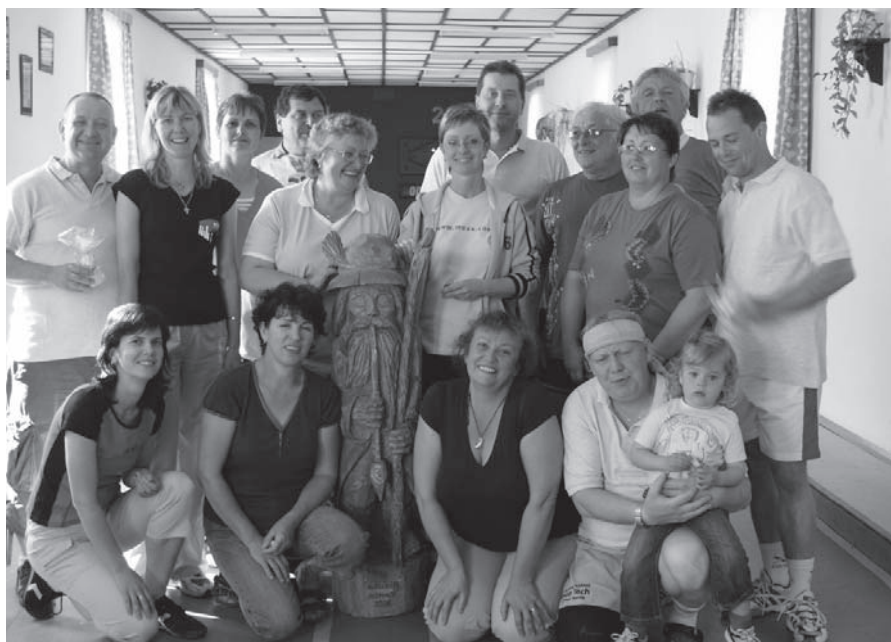
setkání s Krakonošem