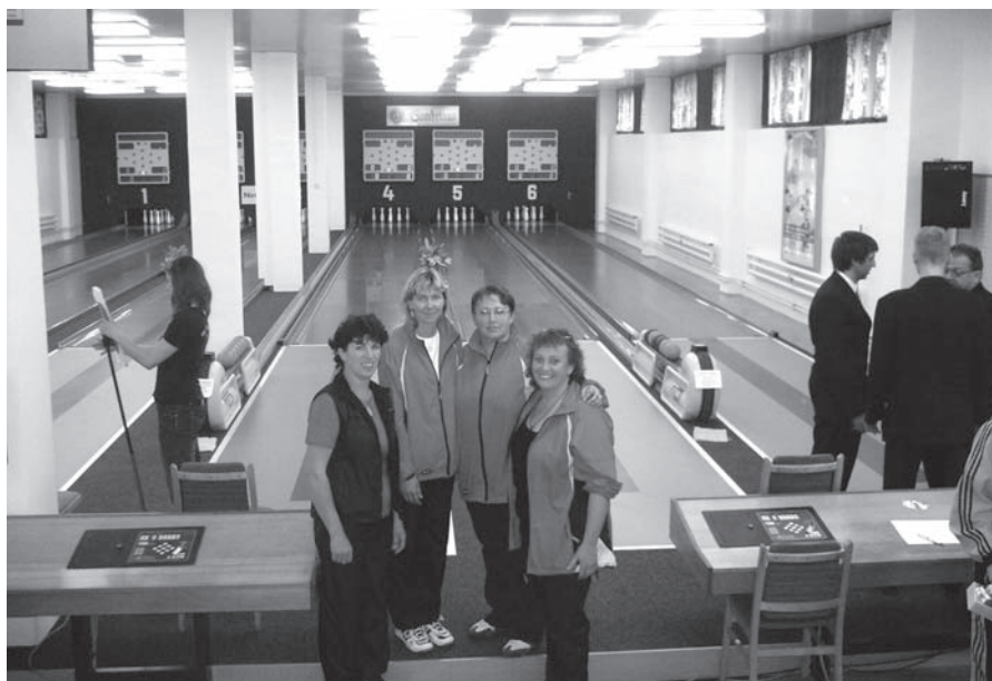
na Mistrovství republiky

Po obhlídce Dílů z terasy naší Tyrolky oblékly aby kuželkářské týmy své dresy a nastoupily k přátelskému zápasu. A protože všichni vyhráli, byli spokojení, vládla příjemná nálada, ostatně jako při všech vzájemných návštěvách. A víte proč? Protože na vše dohlížel Pán hor – sám Krakonoš!