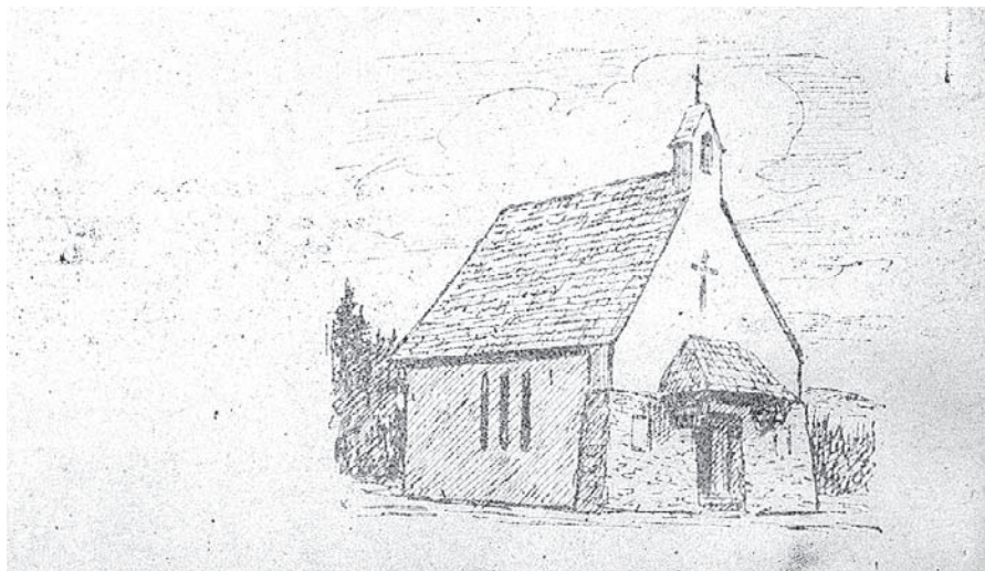
reprodukce kresby kapličky od Karla Kuneše

Dále byla také v měsíci květnu podána žádost o poskytnutí dotace z Programu rozvoje venkova na další hrací prvky (lezecká stěna, kolotoč, pružinové houpadlo, kreslicí