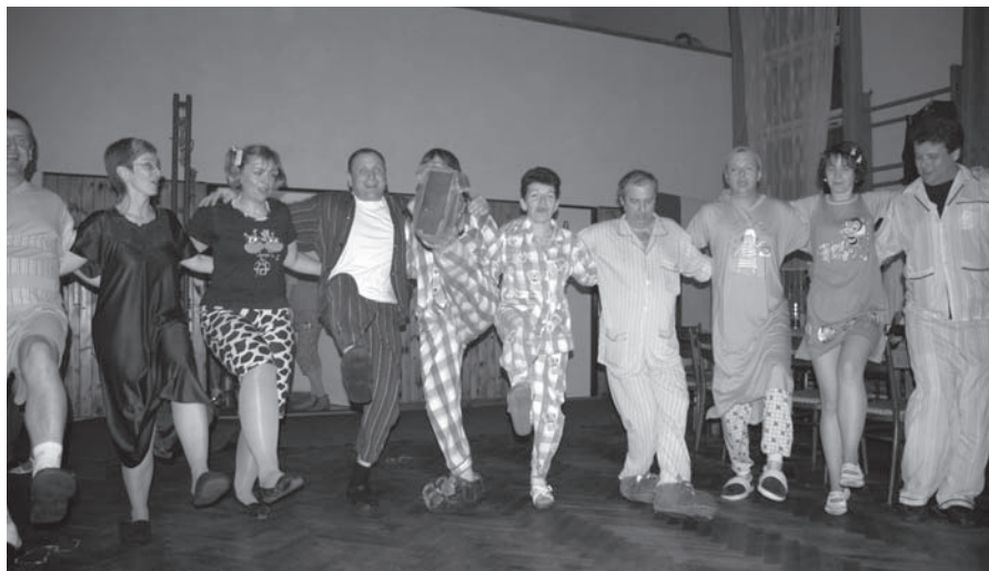
vaselí na pyžamovém bále

Na úseku sportu připravují hasiči na den 13. června již tradiční 12. cyklo výlet na Přimdu a na Sycherák, kterého se zúčastnilo 26 cyklistů a 14 pěších turistů.