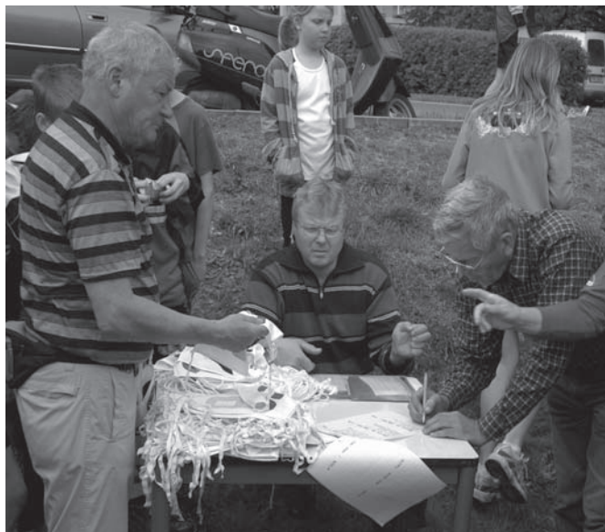
rozdávání startovních čísel