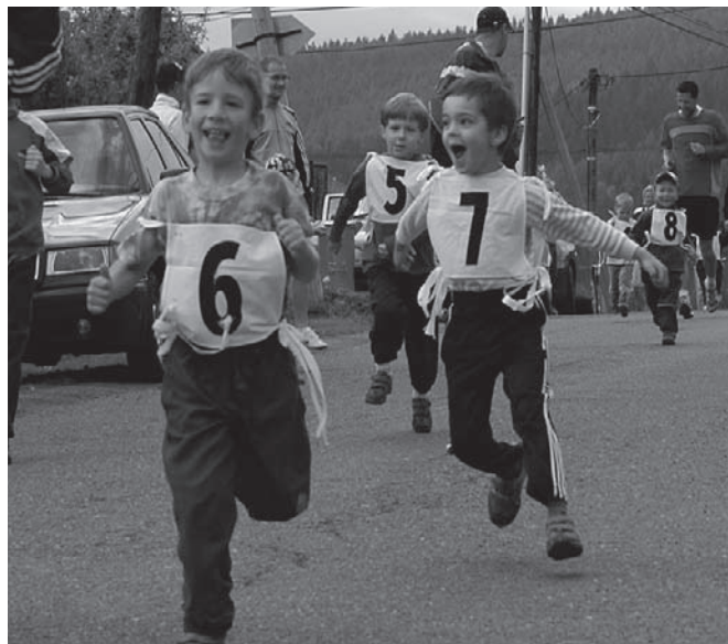
finiš závodu na 100m