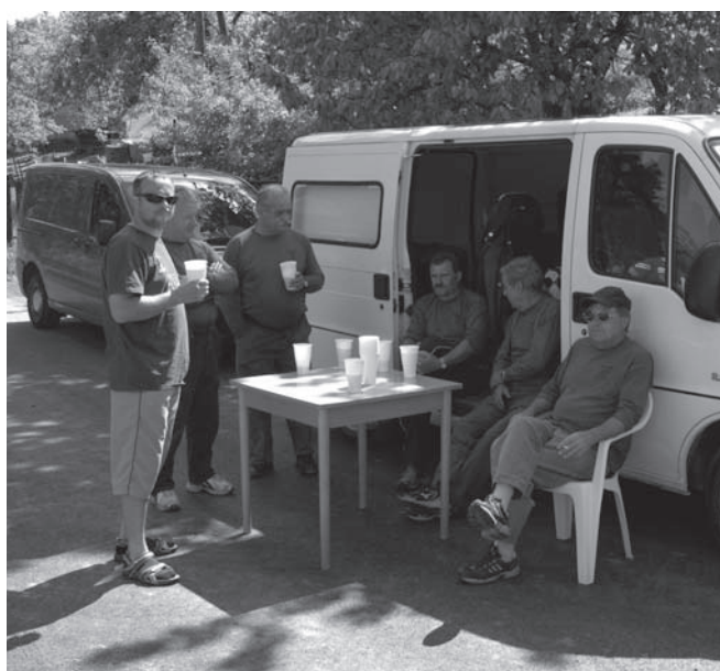
pohoda po dobrém výkonu