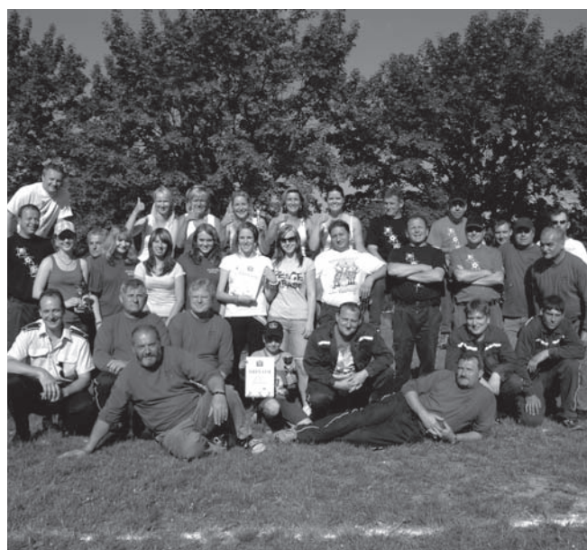
hasiči po soutěži