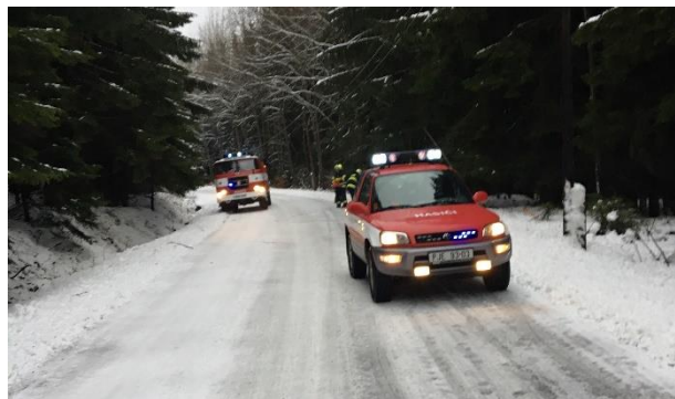
(Zásah 13.1. 2019,)