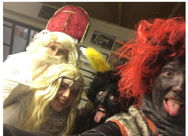
Identitu Mikuláše, anděla a pekelníků nebudeme s ohledem na zlobivé děti prozrazovat 😊