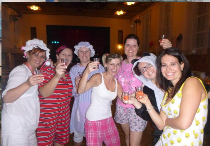
Foto vlevo nahoře: Vyřezávání halloweenských dýní; vpravo nahoře: Náročná manipulace se stříbrným smrkem od Malíčků; dole vlevo: Starosta Rötzu v doprovodu symbolických vánočních dětí; vpravo dole: Pyžamový bál stál za to