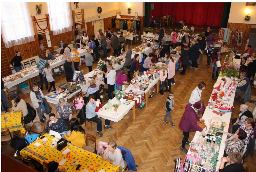
Na letošní vánoční trh zavítalo více než 700 návštěvníků.

Letošní dílský vánoční trh se nesl v duchu charity. Organizátoři se dohodli, že vstupné z letošního ročníku po odečtení nákladů bude rozděleno rovným dílem mezi sociálně terapeutickou dílnu sv. Josefa v Meclově a klenečský Robinson, zařízení pro děti