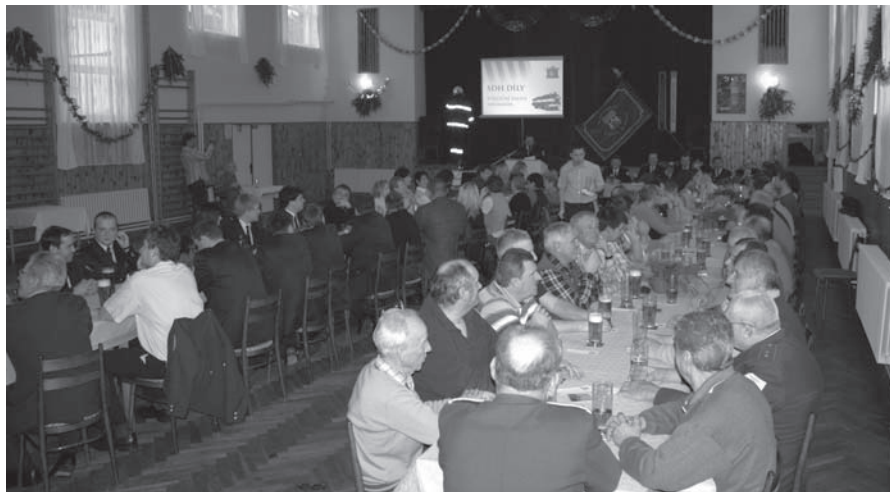
Zaplňený obecní sál při výroční valné hromadě SDH.