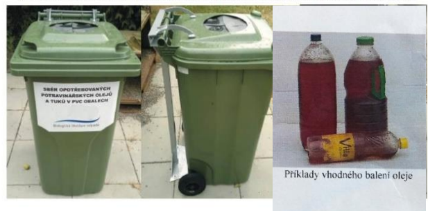
Příklady vhodného balení oleje