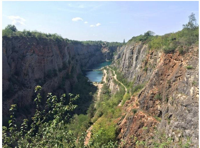
Foto: Veteránky na expedici, Malá Amerika, (archiv A. Kabourkové)