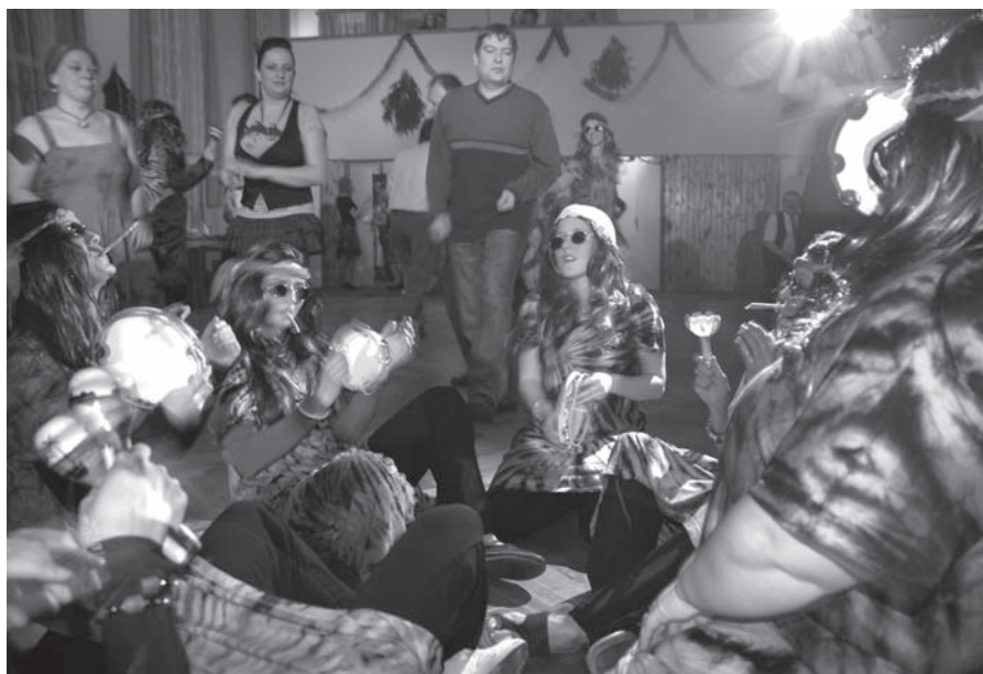
Silvestrovské hippies vystoupení sester

Dne 20. března se 18 členů sboru zúčastní exkurse k záchrannému zásahovému sboru na letišti v Ruzyni, v měsíci květnu budou již opět zahájeny soutěže družstev, na měsíc červen počítají členové sboru s cyklistickým zájezdem, někteří určení členové sboru se zúčastní štábního cvičení na Baldově, po roztátí sněhu počítají hasiči opět s úklidem středu obce a tak aktivně vstupují do roku 2010.