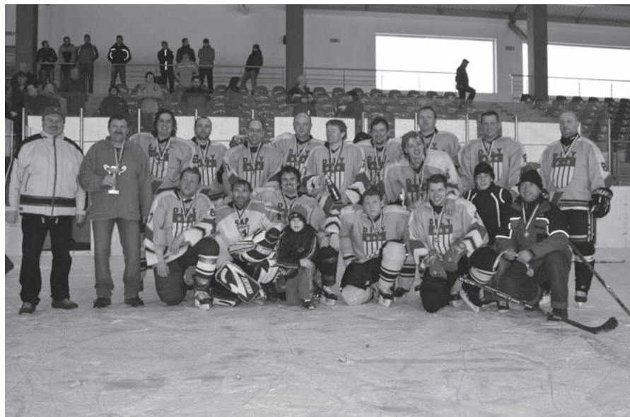
Tým HC Sokol Díly

Dne 6.3.2010 hráči HC Sokol Díly úspěšně zakončili sezonu 2009/2010 Chodské ligy, kdy hráli proti týmu HC Sokol Kanice a tento zápas naši vyhráli 6:3 za velké podpory svých věrných fanoušků. Naši získali celkem