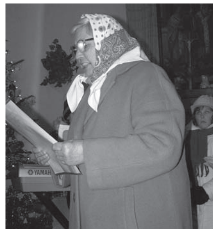
Zpívání v kapli

O programu budou občané informováni v příštím čísle Dílčáku.