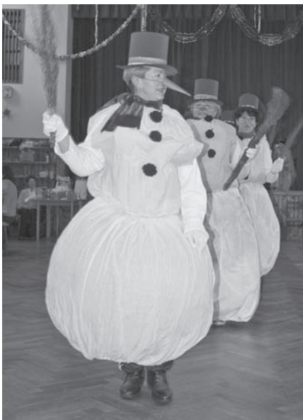
Krásné kostýmy sněhuláků

A co že chystají kuželkářky příští rok? Tak