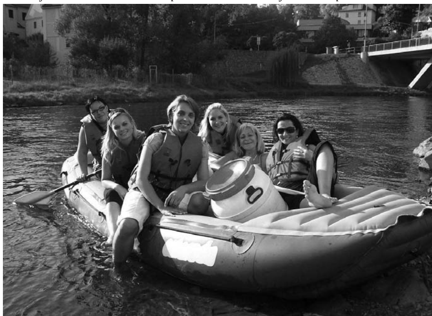
Sestry v akci

Ve dnech 22.9.-25.9.2011 měli vyjet členové našeho sboru na návštěvu do obce Žichlínek nedaleko Ústí nad Orlicí. Z obce Žichlínek jsme zakoupili vozidlo ŠKODA