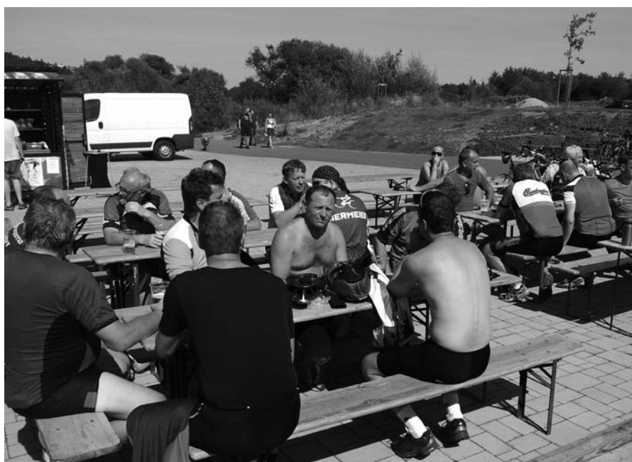
Z cyklovýletu na Berouнку – občerstvení v parném dni