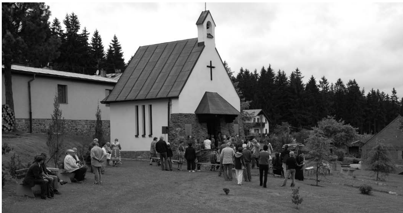
Prostranství před kapličkou před začátkem poutní mše svaté.