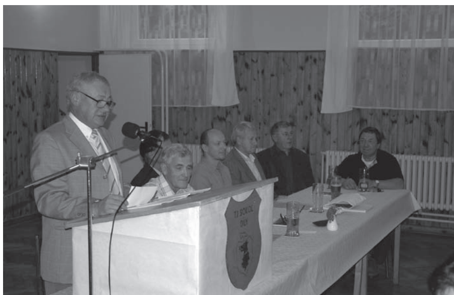
Z výroční schůze TJ Sokol Díly

Sbor dobrovolných hasičů Díly přeje všem svým členům a i všem dílským občanům do nového roku 2011 hodně zdraví, štěstí a spokojenosti a také to abychom se spolu vidali jen u příjemných událostí a abyste nikdy nepotřebovali naši pomoc, i když jsme na ni vždy připraveni. Srdečně přejí členové výboru.